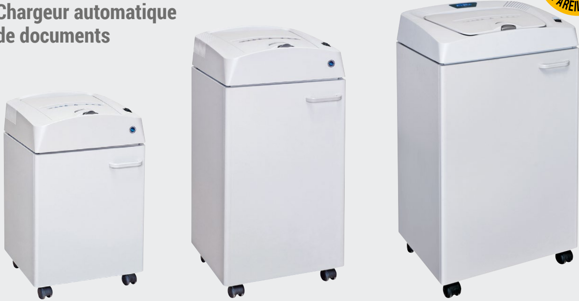
| Kobra AF+1.1